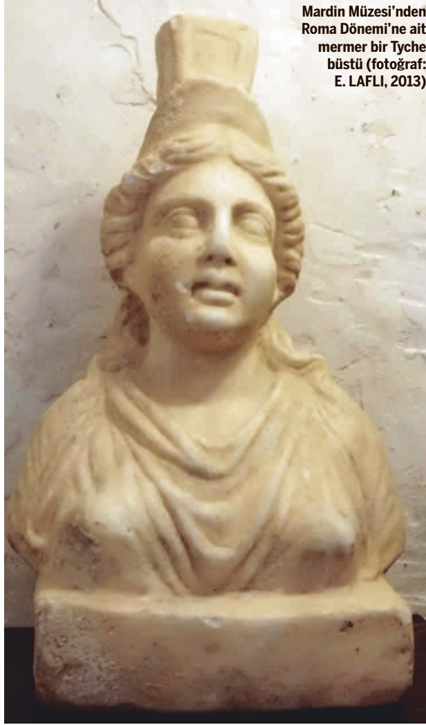
Mardin Müzesi'nden Roma Dönemi'ne ait mermer bir Tyche büstü

Bu oturumun son konuşmacısı ise A.B.D.'den, Texas Tech University'den araştırmacı Yard. Doç. Dr. Esen ÖGÜŞ idi. Harvard University'de doktora yapmış olan Dr. ÖGÜŞ Anadolu kökenli sarkophaglar üzerine oldukça başarılı bir sunum yaptı. ÖGÜŞ Roma Dönemi Anadolu üretimi lahitleri Roma ve