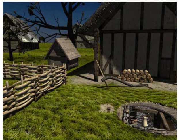
Reconstitution 3D d'une maison gauloise d'après les vestiges archéologiques trouvés sur le site du Palais de Justice