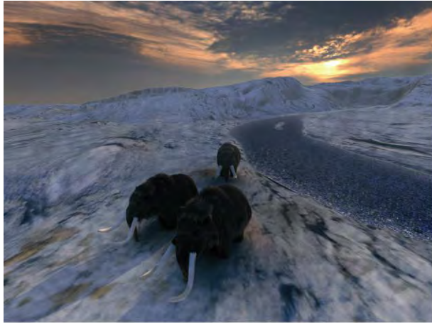
Reconstitution 3D de l'environnement du site de Besançon lors de la dernière glaciation