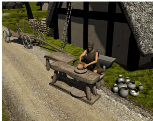
Scène de potier dans l'oppidum gaulois