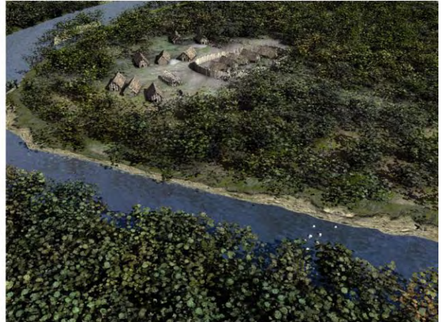
Reconstitution 3D de l'habitat néolithique localisé à l'intérieur de la "boucle" de Besançon