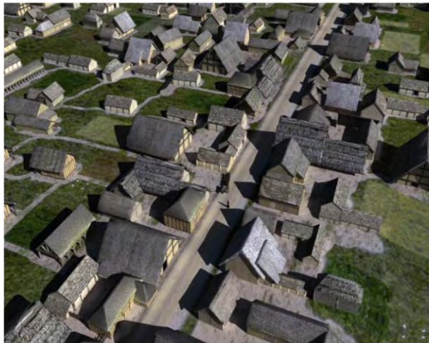
Reconstitution 3D de l'oppidum gaulois