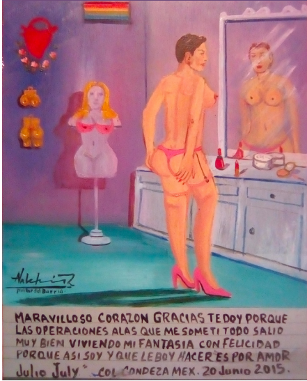
© Alfredo Vichis Roque, Exvoto , cortesía del artista